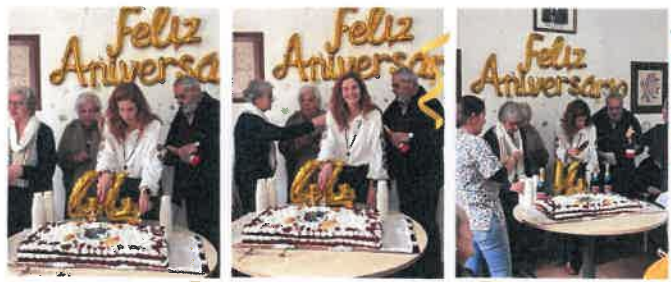
44.º Aniversário dos Avós