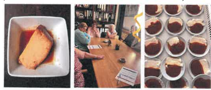
Projeto Saberes e Sabores de Portugal